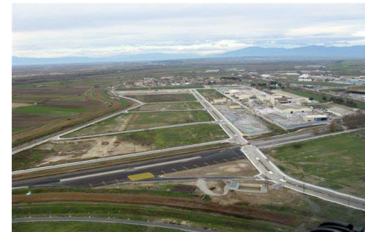
Υποδομές ΕΠ (δρόμοι, αποχετευτικά δίκτυα, ύδρευση, κ.λπ.)