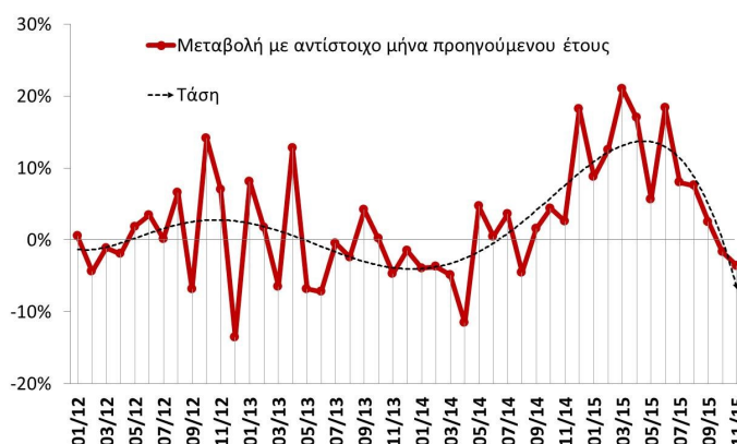
Διάγραμμα 1: Εξέλιξη εξαγωγών (πλην καυσίμων)

Συνολικά, κατά το διάστημα Ιαν – Νοε 2015, η αξία των εξαγωγών πλην πετρελαιοειδών, ανήλθε στα €16,7 δισ. περίπου