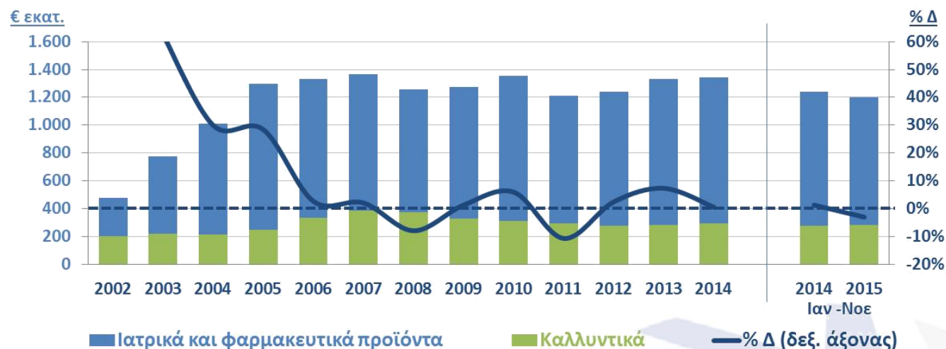
Διάγραμμα 3: Εξαγωγές φαρμάκων και καλλυντικών

Αναφορικά με τις εισαγωγές του κλάδου, το πρώτο 11μηνο του 2015 ανήλθαν στα €3,2 δισ., παρουσιάζοντας αύξηση +1,5% σε σύγκριση με το αντίστοιχο διάστημα του 2014, γεγονός το οποίο, σε συνδυασμό με τη μείωση των εξαγωγών, συνέβαλε στη διόγκωση του εμπορικού ελλείμματος κατά €83 εκατ. Ωστόσο, αν εξαιρεθούν τα καλλυντικά, το εμπορικό ισοζύγιο του φαρμακευτικού κλάδου συνεχίζει να παρουσιάζει βελτίωση (μείωση του ελλείμματος κατά -13,7%).