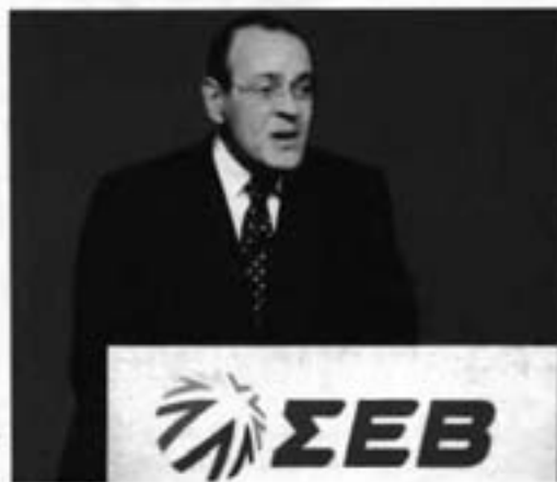
«Ο λόγος πρέπει ναμ να δοθεί στον έλλη να λαό προκειμένου να αποφασίσει αν θα προχωρήσουμε στην Ευρώπη που επιβάλλει ο ευρωπαϊκός προσημασμός ή αν θα κινήσουμε από το κράτος της Ευρωπαϊκής και περιλαμβανομένων άλλων μέλων» αποφασίζει ο πρόεδρος του ΣΕΒ Δημήτρης Δασκαλόπουλος.

«Παίτε τις αλλαγές στους Έλληνες πολίτες χωρίς εκπαιδευση και να αποφασίσουν αν θέλουν να μείνουν ή να φύγουν από την κοινή γνώμη ότι δεν υπάρχει επιλογή στην αναπτυξιακή φροντίδα του έλλη. Η αναδοξία είναι, όπως κι αν έρθει, όπως μαρτυρεί η αν πύρα, θα είναι λίγη μόνο αν πρώτα έλκουμε και τη φροντίδα της πλημής των ελλοματών και του κράτους», όπως ο Δημήτρης Δασκαλόπουλος.