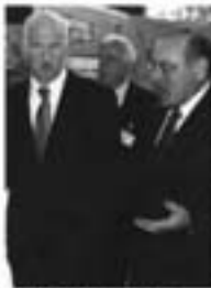
Ο πρόεδρος του ΣΕΒ κ. Γ. Παπαδημιτρίου και ο πρόεδρος της κυβέρνησης κ. Κ. Σαμαράς...