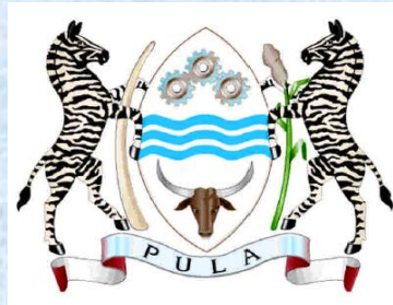
REPUBLIC OF BOTSWANA