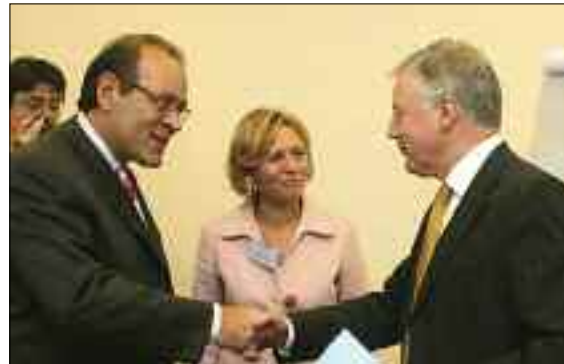
Από τη συνάντηση του Προέδρου και του ΔΣ του ΣΕΒ με τον Γενικό Γραμματέα της Συνομοσπονδίας των Ευρωπαϊκών Συνδικάτων (ETUC) κ. John Monks, στα γραφεία της Συνομοσπονδίας στις Βρυξέλλες (17/10/2006)