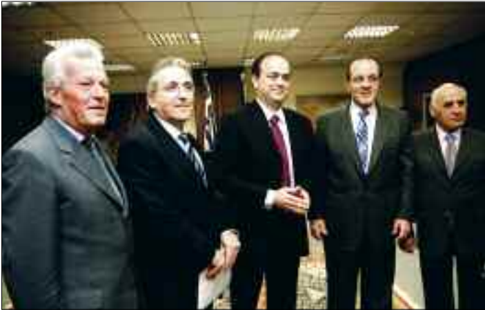
Συνεδρίαση της Εθνικής Επιτροπής Απασχόλησης με τη συμμετοχή των Κοινωνικών Εταίρων (7/5/2007).

Τη χρονιά που πέρασε, ο Υπουργός Απασχόλησης και Κοινωνικής Προστασίας συνεκάλεσε δύο φορές την Εθνική Επιτροπή Απασχόλησης με στόχο την ανταλλαγή απόψεων με τους κοινωνικούς εταίρους για την αντιμετώπιση της ανεργίας και την αύξηση της απασχόλησης. Στα θέματα που συζητήθηκαν στην Επιτροπή περιλαμβάνεται και η πρόταση για δημιουργία Ειδικού Ταμείου Κοινωνικής Αλληλεγγύης.