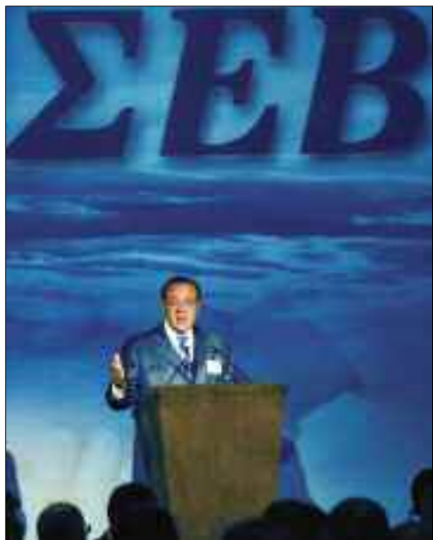
Ο Πρόεδρος του ΣΕΒ κ. Δημήτρης Δασκαλόπουλος χαιρετίζει τις εργασίες του Ελληνο-Κορεατικού Επιχειρηματικού Φόρουμ, στο οποίο παρέστη ο Πρόεδρος της Δημοκρατίας της Κορέας κ. Roh Moo Hyun (4/9/2006)

Το Πρόγραμμα Δράσης του Συνδέσμου Ελληνικών Βιομηχανιών για την περίοδο 2006-08 συζητήθηκε στο Δ.Σ. του Συνδέσμου της 15ης Ιουλίου 2006.