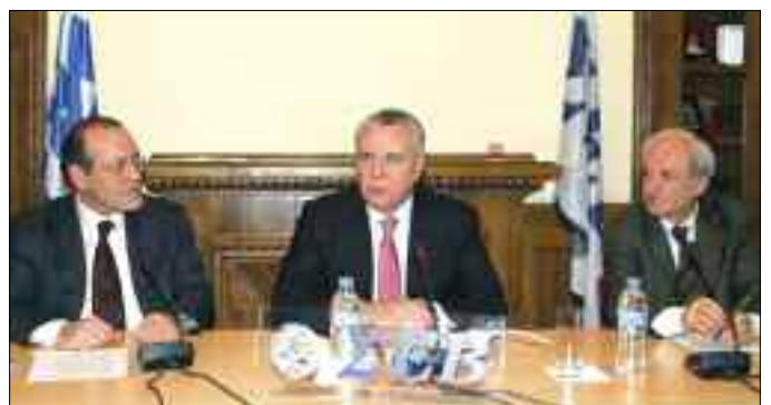
Στιγμιότυπο από τη συνεδρίαση του Γενικού Συμβουλίου του ΣΕΒ με επίσημο προσκεκλημένο τον Υπουργό Δικαιοσύνης κ. Αναστάση Παπαληγούρα (5/2/2007)