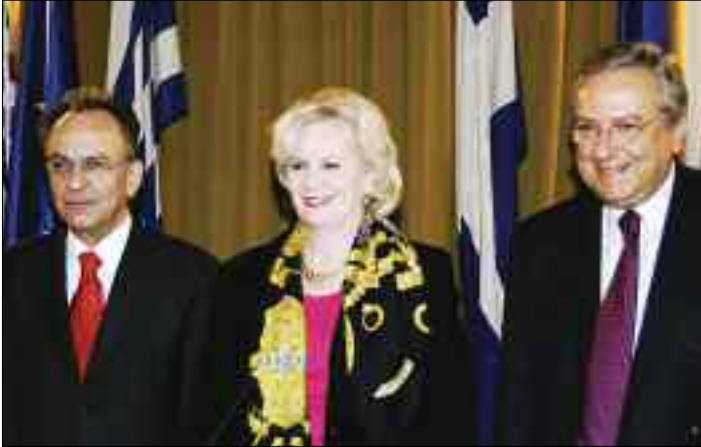
Από την εκδήλωση για την «Ανταγωνιστικότητα και την Εθνική Ευημερία», που διοργανώθηκε από τον ΣΕΒ, το ΕΣΑΑ και το Επιχειρηματικό Συμβούλιο Ελλάδας-ΗΠΑ, με κεντρική ομιλήτρια την Πρόεδρο του Συμβουλίου Ανταγωνιστικότητας των Η.Π.Α., κα Deborah Wince-Smith (22/1/2007)

Η συνεδρίαση του Δεκεμβρίου του 2006 πραγματοποιήθηκε στα Ιωάννινα ύστερα από πρωτοβουλία του Υπουργού Ανάπτυξης, για συνεδριάσεις και σε άλλες πόλεις εκτός της Αθήνας, με σκοπό την καλύτερη διάδοσή του και την αύξηση της συμμετοχής περιφερειακών φορέων.