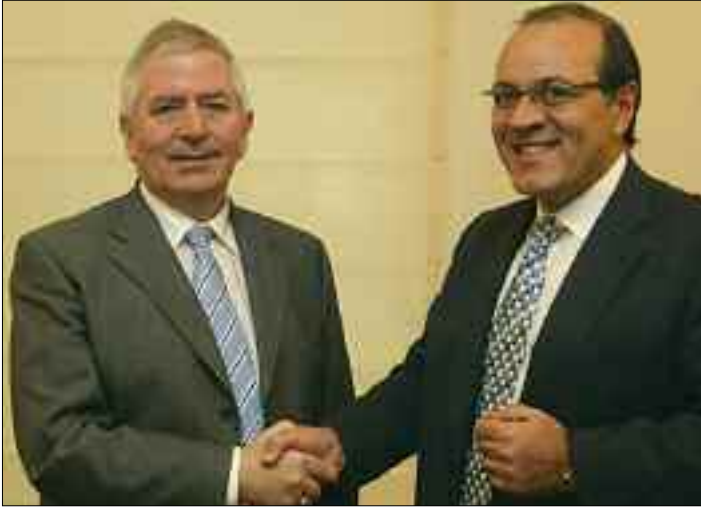
Στο πλαίσιο της επίσκεψης του Δ.Σ του ΣΕΒ στις Βρυξέλλες, ο Πρόεδρος κ. Δημήτρης Δασκαλόπουλος συνάντησε τον αρμόδιο Επίτροπο της Ε.Ε. για θέματα Εσωτερικής Αγοράς, κ. McCreevy (18/10/2006)

κε η νομοθεσία για τα χημικά προϊόντα (REACH) και η ευρωπαϊκή πολιτική για τις κλιματικές αλλαγές.