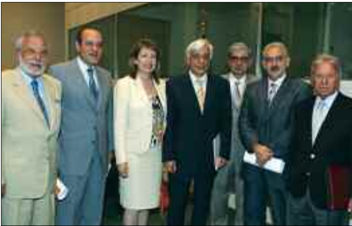
Από την υπογραφή, στο Ζάππειο, του Πρωτοκόλλου Συνεργασίας μεταξύ της Γενικής Γραμματείας Ισότητας του ΥΠΕΣΔΔΑ και των ΣΕΒ, ΓΣΕΒΕΕ, ΕΣΕΕ, ΕΒΕΑ, Ελληνικού Δικτύου για την ΕΚΕ, για την προώθηση ίσων ευκαιριών για γυναίκες και άνδρες στις επιχειρήσεις (2/6/2006)

Στις 2 Ιουνίου 2006 υπεγράφη Πρωτόκολλο Συνεργασίας για την προώθηση ίσων ευκαιριών για γυναίκες και άνδρες στις επιχειρήσεις μεταξύ της Γενικής Γραμματείας του ΥΠ.ΕΣ.Δ.Α.Α. και των εργοδοτικών οργανώσεων (ΣΕΒ, Γ.Σ.Ε.Β.Ε.Ε., Ε.Σ.Ε.Ε.), του ΕΒΕΑ και του Ελληνικού Δικτύου για την Εταιρική Κοινωνική Ευθύνη.