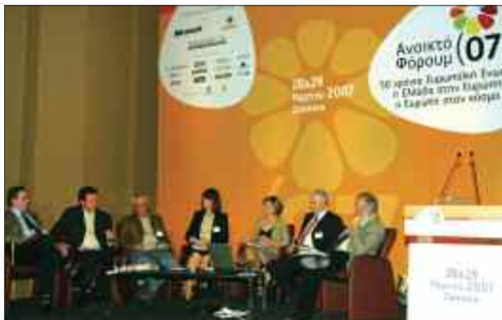
Παρουσίαση και σχολιασμός των Συμπερασμάτων της Πανελλαδικής Έρευνας Κοινού για την Ευρώπη στο πλαίσιο των εργασιών του Ανοικτού Φόρουμ 07 για τα 50 χρόνια της Ε.Ε. (29/3/2007)

Στις 25 Μαρτίου 2007 συμπληρώθηκε μισός αιώνας από την ίδρυση της Ευρωπαϊκής Ένωσης. Με την ευκαιρία της συμπλήρωσης 50 χρόνων από τη συνθήκη της Ρώμης, με την οποία δημιουργήθηκε η Ευρωπαϊκή Ένωση, ο ΣΕΒ διοργάνωσε στις 28 & 29 Μαρτίου 2007, στο Ζάππειο Μέγαρο, το Ανοικτό Φόρουμ 07, με θέμα: «50 χρόνια Ευρωπαϊκή Ένωση: η Ελλάδα στην Ευρώπη - η Ευρώπη στον κόσμο».