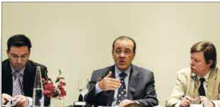
Στιγμιότυπο από την ομιλία-συνέντευξη Τύπου του Προέδρου του ΣΕΒ, κ. Δημήτρη Δασκαλόπουλου, που παρέθεσε προς τιμήν του, η Ένωση Ανταποκριτών Ξένου Τύπου Ελλάδος (23/4/2007)