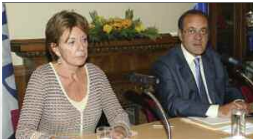
Συνεδρίαση του Γενικού Συμβουλίου του ΣΕΒ με επίσημη προσκεκλημένη την κα Neelie Kroes, Επίτροπο της Ευρωπαϊκής Ένωσης για θέματα Ανταγωνισμού (4/10/2006)

Τέλος, ο ΣΕΒ παρακολουθεί τις εργασίες της Επιτροπής Επιχειρηματικότητας και Μικρομεσαίων Επιχειρήσεων. Τα θέματα που απασχόλησαν την Επιτροπή την τελευταία περίοδο ήταν τα διπλώματα ευρεσιτεχνίας, τα διεθνή λογιστικά πρότυπα και η προώθηση στρατηγικής για την καινοτομία και η μεταβίβαση μικρομεσαίων εταιριών. Στο πλαίσιο αυτό ο ΣΕΒ συνεργάστηκε στη διαμόρφωση ερωτηματολογίου της BUSINESSEUROPE για την πολιτική που πρέπει να ακολουθήσει η Ευρωπαϊκή Επιτροπή σε διάφορα ειδικά θέματα που αφορούν τις Μικρομεσαίες επιχειρήσεις. Επίσης ενημέρωσε τα μέλη του για τα Ευρωπαϊκά Προγράμματα στα οποία μπορούν να συμμετέχουν οι μικρομεσαίες, ενώ μετείχε σε συνέδριο του ΟΟΣΑ για την εξάλειψη εμποδίων πρόσβασης των μικρομεσαίων στις διεθνείς αγορές.