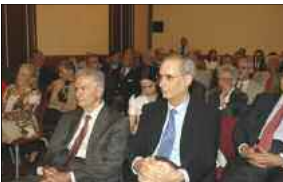
Στιγμιότυπο από τη συνεδρίαση του Γενικού Συμβουλίου (7/5/2007)

Έτσι οι Δημόσιες Σχέσεις οργάνωσαν ή/και παρείχαν υποστήριξη, εκτός από την Ετήσια Γενική Συνέλευση του ΣΕΒ, σε σημαντικό αριθμό εκδηλώσεων κατά το τελευταίο δωδεκάμηνο.