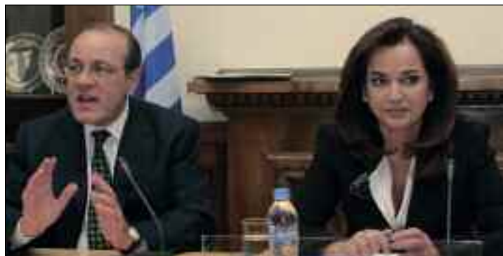
Συνεδρίαση του Γενικού Συμβουλίου του ΣΕΒ με επίσημη προσκεκλημένη την Υπουργό Εξωτερικών, κα Ντόρα Μπακογιάννη, (8/1/2007)