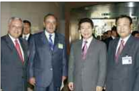
Από το Επιχειρηματικό Φόρουμ Ελλάδας -Κορέας, που συνδιοργάνωσε ο ΣΕΒ με τους Κορεατικούς επιχειρηματικούς φορείς Korea International Trade Center & Federation of Korean Industries, στην Αθήνα (4/9/2006)

Για την παροχή άμεσης πληροφόρησης στα μέλη σχετικά με το επιχειρηματικό περιβάλλον ξένων χωρών και εξελίξεις στην οικονομία τους καθώς και για εμπορικές και επενδυτικές ευκαιρίες έγινε αναδιοργάνωση του Πεδίου «διεθνείς συνεργασίες» στην ιστοσελίδα του ΣΕΒ, έτσι ώστε να καταχωρούνται άμεσα τα στοιχεία κατά χώρα και να αξιοποιείται η επικαιρότητά τους. Παράλληλα περιλαμβάνονται και στην εγκύκλιο που αποστέλλεται ηλεκτρονικά στα μέλη.