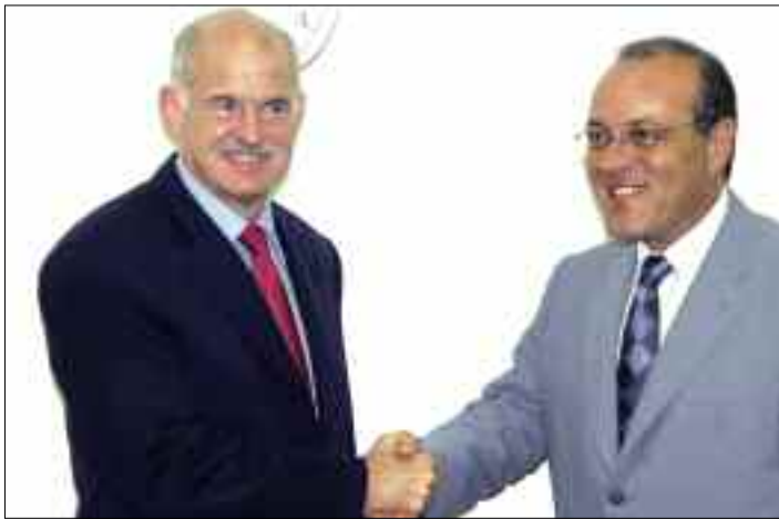
Από τη συνάντηση της Διοίκησης και του Προέδρου του ΣΕΒ κ. Δημήτρη Δασκαλόπουλου με τον Αρχηγό της Αξιωματικής Αντιπολίτευσης κ. Γιώργο Α. Παπανδρέου (31/8/2006)

Σημαντικότερα απ' αυτά είναι τα πάσης φύσεως εμπόδια στην επιχειρηματικότητα και την ανταγωνιστικότητα: φορολογικά, διοικητικά, ρυθμιστικά, παρεμβατικά. Η Ελλάδα εμφανίζεται σήμερα ως η χώρα με τα περισσότερα εμπόδια και το υψηλότερο κόστος που απαιτούνται για την έναρξη επιχειρηματικής δραστηριότητας.