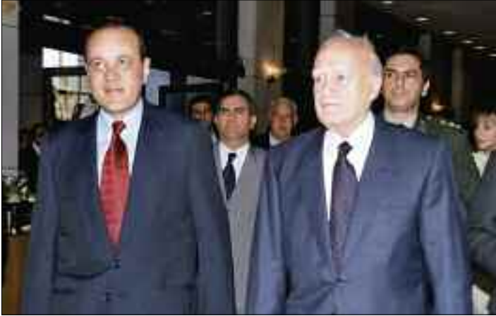
Ο Πρόεδρος της Δημοκρατίας κ. Κάρολος Παπούλιας προσέρχεται στη Γενική Συνέλευση του ΣΕΒ (16/5/2006)

Τους τελευταίους 12 μήνες (Απρίλιος 2006-Απρίλιος 2007) το επιχειρηματικό περιβάλλον στην Ελλάδα παρουσιάζεται σαφώς βελτιωμένο και όλα τα διαθέσιμα στοιχεία συνηγορούν στην εκτίμηση ότι η ελληνική οικονομία βρίσκεται την περίοδο αυτή σε ανοδική φάση. Συγκεκριμένα, το 2006 ο ρυθμός ανάπτυξης ξεπέρασε όλες τις προβλέψεις και επιταχύνθηκε σε σχέση με τον προηγούμενο χρόνο, ενώ και για το 2007 προβλέπεται ότι ο υψηλός αυτός ρυθμός θα διατηρηθεί. Συμπληρώνεται έτσι μια μακρά περίοδος 14 ετών ισχυρής και αδιάταρακτης ανάπτυξης της ελληνικής οικονομίας, ενώ τα τελευταία δέκα χρόνια η άνοδος είναι ταχύτερη από τις άλλες χώρες της Ευρωζώνης με αποτέλεσμα τη σύγκλιση του κατά κεφαλήν εισοδήματος στο μέσο όρο της Ευρωζώνης: το 2006 το ελληνικό κατά κεφαλήν εισόδημα προσεγγίζει το 80%, σε σύγκριση με 64% του μέσου κατά κεφαλήν εισοδήματος της ευρωζώνης που ήταν το 1988.