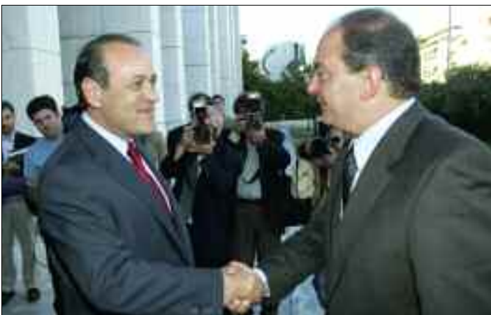
Ο Πρόεδρος του ΣΕΒ κ. Δημήτρης Δασκαλόπουλος υποδέχεται τον Πρωθυπουργό κ. Κώστα Καραμανλή στη ΓΣ του ΣΕΒ (16/5/2006)

Από την πλευρά τους οι ελληνικές επιχειρήσεις, ανταποκρινόμενες στη βελτίωση των μακροοικονομικών συνθηκών κινητοποιήθηκαν με δυναμισμό, παρέκαμψαν τα