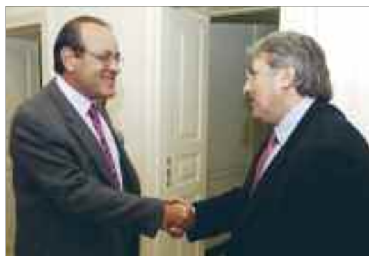
Στιγμιότυπο από τη συνάντηση της διοίκησης του ΣΕΒ με τη διοίκηση της ΓΣΕΕ, που πραγματοποιήθηκε στα γραφεία της Συνομοσπονδίας (27/9/2006)