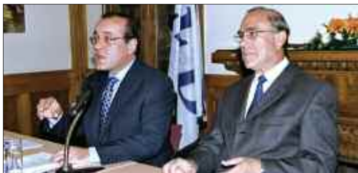
Ο νέος Γενικός Γραμματέας του Οργανισμού Οικονομικής Συνεργασίας και Ανάπτυξης (ΟΟΣΑ) κ. Angel Gurría, απευθύνεται στα μέλη του Γενικού Συμβουλίου του ΣΕΒ (26.6.2006)

Ο ΣΕΒ θεωρεί πως η ανάπτυξη ενός ευνοϊκού επιχειρηματικού περιβάλλοντος είναι παράγων πρωταρχικής σημασίας για την ανάπτυξη νέων επιχειρηματικών δράσεων και της ελληνικής οικονομίας γενικότερα.