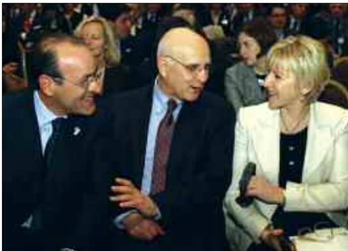
Στιγμιότυπο από τις εργασίες του Ανοικτού Φόρουμ 07, όπου διακρίνονται ο κ. Δ. Δασκαλόπουλος, Πρόεδρος του ΣΕΒ, ο κ. Σταύρος Δήμας, Επίτροπος της Ευρωπαϊκής Επιτροπής για το Περιβάλλον και η κα Margot Wallstrom, Αντιπρόεδρος της Ευρωπαϊκής Επιτροπής, Επίτροπος για τις διοργανικές σχέσεις και την επικοινωνιακή στρατηγική (29/3/2007)

Τέλος, ο πρώην Πρόεδρος του ΣΕΒ κ. Οδυσσέας Κυριακόπουλος συμμετείχε σε ημερίδα του Ευρωπαϊκού Κοινοβουλίου με θέμα το μέλλον της Ευρω-μεσογειακής συνεργασίας με την ιδιότητα του Προέδρου του Δικτύου των ευρω-μεσογειακών υποθέσεων της BUSINESSEUROPE.