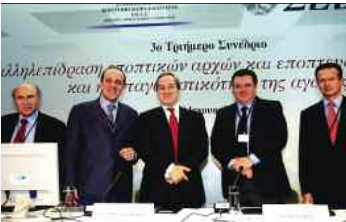
Στιγμιότυπο από τις εργασίες του Τριήμερου Συνεδρίου: «Η αλληλεπίδραση εποπτικών αρχών και εποπτευόμενων φορέων και η ανταγωνιστικότητα της αγοράς», που συνδιοργανώθηκε από την Επιτροπή Κεφαλαιαγοράς και τον ΣΕΒ (16-18/1/2007)

Στο πλαίσιο αυτό ο Σύνδεσμος συνδιοργάνωσε στις αρχές του 2007 από κοινού με την Επιτροπή Κεφαλαιαγοράς Τριήμερο Συνέδριο με θέμα: «Η Αλληλεπίδραση εποπτικών αρχών και εποπτευόμενων φορέων και η ανταγωνιστικότητα της αγοράς».