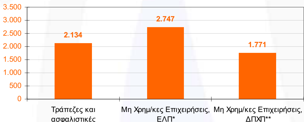
Διάγραμμα 1: Καθαρά κέρδη προ φόρων 2008 (εκ. ευρώ)

* Ισολογισμοί με Ελληνικό Λογιστικό Πρότυπο