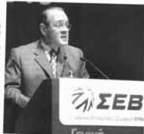
Ο κ. Δασκαλόπουλος απευθύνει ένα σημαντικό μήνυμα στο βουλευτικό σώμα

Υ ποστηρίζω με τη δύναμη της καρδιάς μου την πρόταση που ο κ. Δ. Δασκαλόπουλος, πρόεδρος του ΣΕΒ, υποβάλλει στο βουλευτικό σώμα. Η πρόταση αυτή είναι η καλύτερη απάντηση στην κρίση που αντιμετωπίζει η χώρα μας. Η πρόταση αυτή είναι η καλύτερη απάντηση στην κρίση που αντιμετωπίζει η χώρα μας. Η πρόταση αυτή είναι η καλύτερη απάντηση στην κρίση που αντιμετωπίζει η χώρα μας.