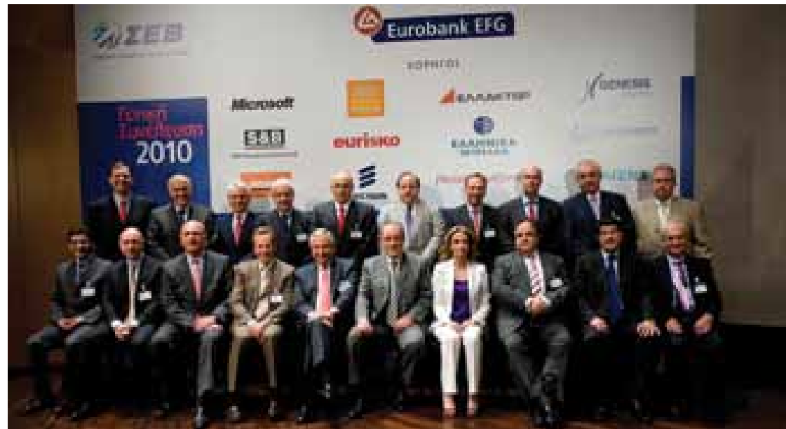
Γενική Συνέλευση ΣΕΒ Αρχαιρεσίες της 11ης Μαΐου 2010 Το νέο Διοικητικό Συμβούλιο