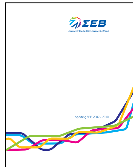
Για την υποστήριξη της παρούσας έκδοσης ευχαριστούμε τον φωτογράφο Νίκο Αποστολόπουλο