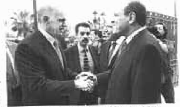
Οι δύο ηγέτες συμφώνησαν στην ανάγκη αντιμετώπισης της κρίσης