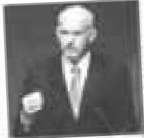
Γενικός Γραμματέας του ΣΕΒ

Μ εταξύ αυτών που απαιτούνται για την ανάπτυξη της χώρας, οι διαρθρωτικές παρεμβάσεις αποτελούν την πιο κρίσιμη προτεραιότητα. Η αντιμετώπιση των προβλημάτων που αντιμετωπίζει η χώρα μας απαιτεί την υιοθέτηση ενός νέου μοντέλου ανάπτυξης, που να βασίζεται στην αριστεία, στην καινοτομία και στην ανταγωνιστικότητα. Η διαρθρωτική μεταρρύθμιση είναι η βάση για την επίτευξη αυτού του στόχου. Η Ελλάδα, ως χώρα με υψηλό δείκτη ανάπτυξης, πρέπει να αντιμετωπίσει τις διαρθρωτικές παρεμβάσεις.