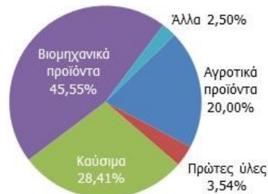
Διάγραμμα 2: % Μεριδία στις εξαγωγές - Απρίλιος 2015

Οι εξαγωγές πρώτων υλών κινούνται επίσης ανοδικά για 3 ο συνεχόμενο μήνα, σημειώνοντας αύξηση 2,4% σε σχέση με τον Απρίλιο του 2014, ενώ κατά το διάστημα Ιανουαρίου - Απριλίου 2015 η αξία τους ανήλθε στα €353,5 εκατ. ενισχυμένη κατά 3,4% σε σύγκριση με πέρυσι. Στα καύσιμα , η πτώση των τιμών διεθνώς εξακολουθεί