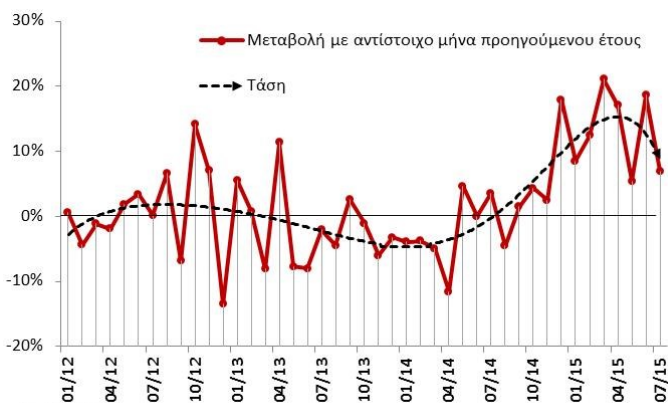
Διάγραμμα 1: Εξέλιξη εξαγωγών (εξαιρουμένων των πετρελαιοειδών)

Η βελτίωση των εξαγωγών μπορεί να στηριχθεί σε προϊόντα με διαχρονική αναγνωσιμότητα και παρουσία σε ξένες αγορές