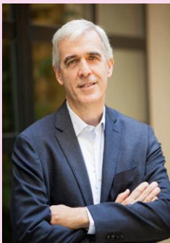
Ποταμίτης Στάθης Εταίρος Ποταμίτης Βεκρής Δικηγορική Εταιρεία