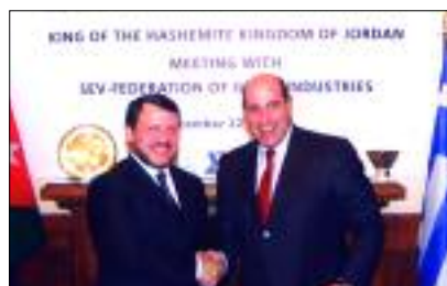
Επίσκεψη στον ΣΕΒ της Α.Μ. του Βασιλέως Abdullah II Bin Al Hussein της Ιορδανίας (22/12/2005)