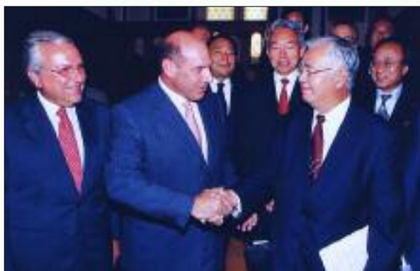
Επίσκεψη στον ΣΕΒ της Ιαπωνικής Επιχειρηματικής Αντιπροσωπείας, του Οργανισμού NIPPON KEIDARNEN (5/9/2005)