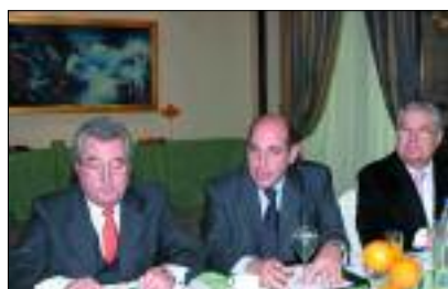
Επίσκεψη στον ΣΕΒ του Γερμανικού Συνδέσμου Εργοδοτών BDA (29-30/11/2005)