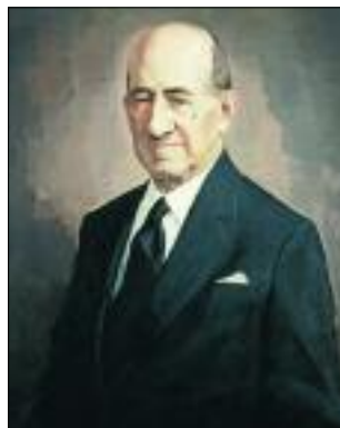
Μποδοσάκης Αθανασιάδης Επίτιμος Πρόεδρος ΣΕΒ