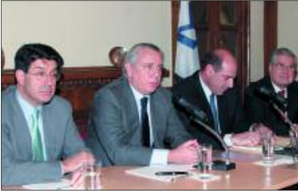
Συνεδρίαση του Γενικού Συμβουλίου του ΣΕΒ παρουσία του Υπουργού Δικαιοσύνης, κ. Αναστάσιου Παπαληγούρα (9/1/2006)

Το Γενικό Συμβούλιο είναι το ανώτατο γνωμοδοτικό όργανο του ΣΕΒ, το οποίο συνεδριάζει μια φορά το μήνα, παρακολουθεί την πορεία των υποθέσεων του Συνδέσμου και γνωματεύει στα θέματα που τίθενται υπόψη του από το Διοικητικό Συμβούλιο.