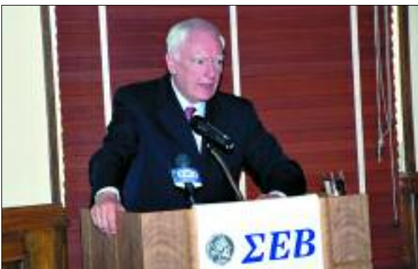
Γεύμα Εργασίας προς τιμή του Προέδρου της Ευρωπαϊκής Τράπεζας Επενδύσεων, κ. Philippe Maystadt (23/6/2005)

Ας σημειωθεί ότι η εκάστοτε διοργάνωση (όπως της Γενικής Συνέλευσης και των Συνεδρίων-Ημερίδων-Εκδηλώσεων & Συναντήσεων του ΣΕΒ) πραγματοποιείται εξ ολοκλήρου με ίδιες δυνάμεις, δεδομένου ότι έχει δημιουργηθεί η κατάλληλη και αποτελεσματική υποδομή και τεχνογνωσία με πολύ καλά αποτελέσματα.