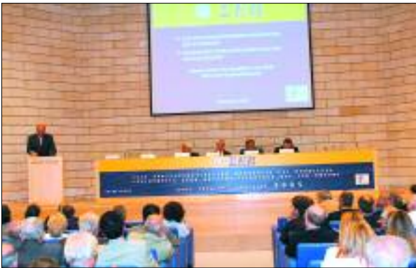
Εκδήλωση του ΣΕΒ με θέμα: 'Για Αποτελεσματικότερη Νομοθεσία και Ρυθμίσεις-Επιπτώσεις στην Ανταγωνιστικότητα και το Κόστος' (16/6/2005)