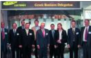
Επιχειρηματική Αποστολή στην Κορέα (12-16/9/2005)