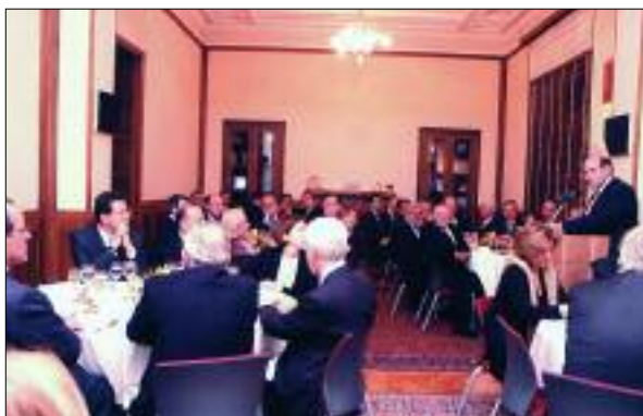
Δείπνο Εργασίας της Διοίκησης του ΣΕΒ προς τιμή του Έλληνα Επιτρόπου, κ. Σταύρου Δήμα στα γραφεία του Συνδέσμου (24/2/2006)