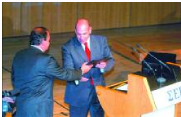
Ο Πρόεδρος του ΣΕΒ, κ. Οδ. Κυριακόπουλος παραδίδει αντίγραφο της Χάρτας στον Πρωθυπουργό, κ. Κ. Καραμανλή, στο πλαίσιο της Ετήσιας Γενικής Συνέλευσης του ΣΕΒ (26/5/2005)

Η δραστηριότητα του ΣΕΒ στο χρόνο που πέρασε επικεντρώθηκε σ' αυτό το κρίσιμο ζήτημα: να προχωρήσουν ταχύτερα οι μεταρρυθμίσεις για να αντιμετωπισθούν οι διαρθρωτικές αδυναμίες της ελληνικής οικονομίας, οι οποίες οδηγούν σε απώλειες της ανταγωνιστικότητας και υποβάθμιση της θέσης της χώρας, στην παγκόσμια αγορά. Σ' αυτή τη βασική θέση εντάσσονται όλες οι δράσεις και παρεμβάσεις του ΣΕΒ που περιγράφονται στον παρόντα απολογισμό.