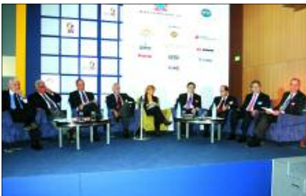
Συζήτηση με τους εκπροσώπους της Επιχειρηματικής Ηγεσίας στα πλαίσια του Ανοικτού Φόρουμ για την Ανταγωνιστικότητα και την Ανάπτυξη (6/12/2005)

Η ολοκλήρωση των εργασιών του Ανοικτού Φόρουμ 05 δεν σήμανε και το τέλος της ύπαρξής του. Αντίθετα, σηματοδότησε μια καινούρια αρχή: ένα διαρκές Ανοικτό Φόρουμ μεταξύ των κοινωνικών εταίρων και της Πολιτείας, μεταξύ των θεσμικών παραγόντων και της ίδιας της κοινωνίας. Σε αυτό το πλαίσιο, ο ανοικτός διάλογος μέσω της ιστοσελίδας του Ανοικτού Φόρουμ συνεχίζει να λειτουργεί με ανανεωμένα θεματικά πεδία ενώ σχεδιάζονται νέες διοργανώσεις στην περιφέρεια.