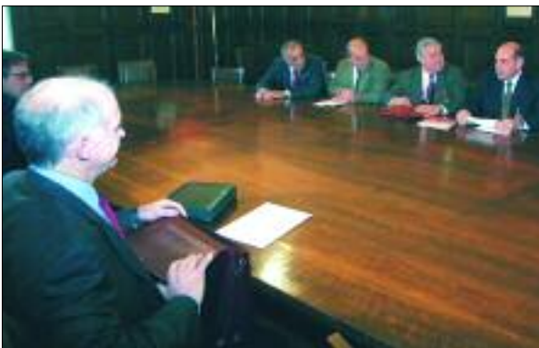
Συνάντηση μελών του Διοικητικού Συμβουλίου του ΣΕΒ με τον Πρόεδρο του ΠΑ.ΣΟ.Κ και Αρχηγό της Αξιωματικής Αντιπολίτευσης κ. Γ. Παπανδρέου (15/12/2005)

Το βασικό αυτό ζήτημα αναδείχθηκε με σαφήνεια και στις εργασίες του Ανοικτού Φόρουμ για την Ανταγωνιστικότητα που οργανώθηκε στις 5 και 6 Δεκεμβρίου 2005 με πρωτοβουλία του ΣΕΒ. Όπως αναφέρεται στα συμπεράσματα του Φόρουμ, μια πολιτική που θέτει την ανταγωνιστικότητα υψηλά στην κλίμακα των προτεραιοτήτων της πρέπει να προχωρήσει αμέσως σε ριζικές αλλαγές για τη δημιουργία ενός πιο αποδοτικού Κράτους και ενός πιο λειτουργικού Δημόσιου Τομέα. Οι παρεμβάσεις αφορούν κυρίως σε δύο τομείς, στη λειτουργία της Δημόσιας Διοίκησης και στην απλούστευση και βελτίωση του νομοθετικού πλαισίου. Στους δύο αυτούς τομείς έγιναν μεν προσπάθειες, χωρίς όμως να αλλάξουν τη βασική διαπίστωση ότι η λειτουργία του Κράτους και της Δημόσιας Διοίκησης εξακολουθούν να αποτελούν εμπόδια της οικονομικής δραστηριότητας.