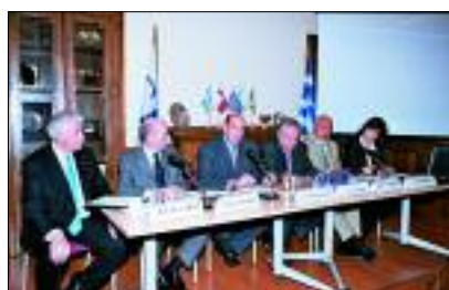
Εκδήλωση για την ανάπτυξη επιχειρηματικών συνεργασιών σε τέσσερις μεγάλες χώρες της Λατινικής Αμερικής (18/4/2006)