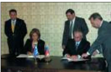
Επιχειρηματική Αποστολή μελών του ΣΕΒ στη Ρωσία (27-30/9/2005)

Επίσης, σε επίσημα ταξίδια στο εξωτερικό ο Πρόεδρος του ΣΕΒ συνόδευσε τον Πρωθυπουργό στην Ιαπωνία και στην Κίνα, ενώ μέλος του Δ.Σ. του Συνδέσμου αρμόδιο για τις διεθνείς σχέσεις μετείχε στην αποστολή του Προέδρου της Δημοκρατίας στην Λιβύη.