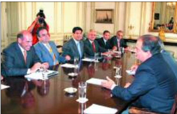
Συνάντηση μελών του Διοικητικού Συμβουλίου του ΣΕΒ με τον πρωθυπουργό, κ. Κ. Καραμανλή, παρουσία του Υπουργού Οικονομίας και Οικονομικών κ. Γ. Αλογοσκούφη (2/9/2005)

Παρά την επιβράδυνση, η οικονομική δραστηριότητα επέδειξε ανθεκτικότητα και παρέμεινε σε σχετικά υψηλά επίπεδα.