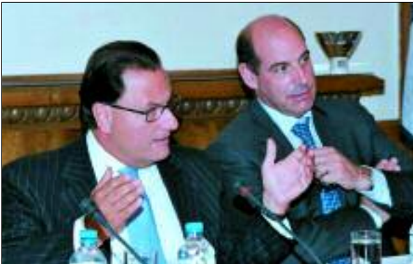
Συνεδρίαση του Γενικού Συμβουλίου του ΣΕΒ παρουσία του πρ.Υπουργού Απασχόλησης και Κοινωνικής Προστασίας, κ. Πάνου Παναγιωτόπουλου (30/11/2005)

Μετά από συνεχείς παρεμβάσεις του ΣΕΒ, το Υπουργείο Απασχόλησης και Κοινωνικής Προστασίας εξέδωσε ερμηνευτική εγκύκλιο που αφορά στην ενιαία εφαρμογή των διατάξεων του άρθρου 1, του Ν. 3302/2004 «Ρύθμιση Ετήσιας Άδειας Εργαζομένων και άλλες διατάξεις». Στην εγκύκλιο παρέχονται διευκρινίσεις σχετικά με τη ρύθμιση της ετήσιας άδειας εργασίας νεοπροσλαμβανόμενου, το επίδομα της ετήσιας άδειας, κ.α.