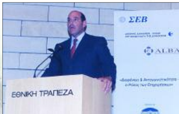
Εκδήλωση του ΣΕΒ με θέμα 'Διαφάνεια και Ανταγωνιστικότητα – Ο Ρόλος των Επιχειρήσεων' (10/5/2005)