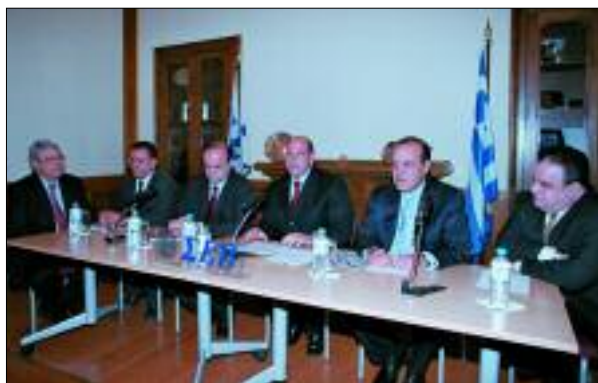
Συνεδρίαση του Γενικού Συμβουλίου του ΣΕΒ παρουσία του Υπουργού Απασχόλησης και Κοινωνικής Προστασίας, κ. Σάββα Τσιπουριδη (13/3/2006)

Στο πλαίσιο του Εθνικού Κοινωνικού Διαλόγου, τη χρονιά που πέρασε ο Υπουργός Απασχόλησης και Κοινωνικής Προστασίας, συνεκάλεσε δύο φορές την Εθνική Επιτροπή Απασχόλησης με στόχο την ανταλλαγή απόψεων με τους κοινωνικούς εταίρους για την αντιμετώπιση της ανεργίας και την αύξηση της απασχόλησης όπου συμφωνήθηκαν τα εξής :