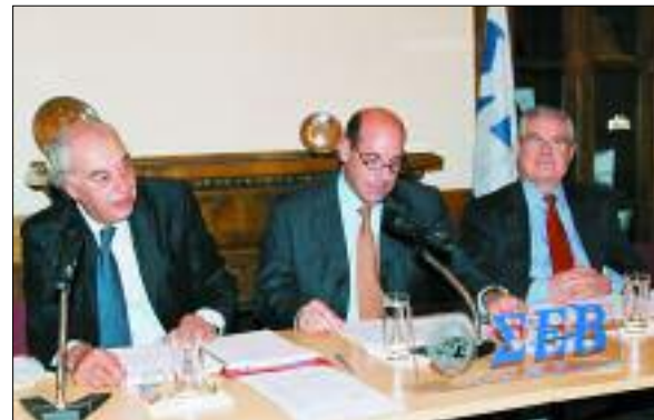
Συνεδρίαση του Γενικού Συμβουλίου του ΣΕΒ με την παρουσία του Διοικητού του ΙΚΑ-ΕΤΑΜ, κ. Ιωάννη Βαρθολομαίου (14/11/2005)