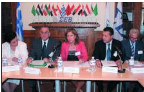
Συζήτηση Στρογγυλής Τραπέζης για την επέκταση και προώθηση των επιχειρηματικών συνεργασιών μεταξύ της Ελλάδος και των Αραβικών Χώρων (3/10/2005)

Επίσης με την ευκαιρία της ανακήρυξης, από τον Υπουργό Ανάπτυξης, του έτους 2005 ως Έτος Ανταγωνιστικότητας ο ΣΕΒ πραγματοποίησε την Εκδήλωση με θέμα «Για αποτελεσματικότερη Νομοθεσία και Ρυθμίσεις - Επιπτώσεις στην Ανταγωνιστικότητα και στο Κόστος» (16/6/2005) και το «Ανοικτό Φόρουμ 05 για την Ανταγωνιστικότητα και την Ανάπτυξη» (5 & 6/12/2005).