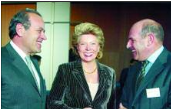
Η Επίτροπος της Ευρωπαϊκής Επιτροπής, Υπεύθυνη Θεμάτων για την Κοινωνία της Πληροφορίας και τα Μέσα Ενημέρωσης, κα Viviane Reding στο Ανοικτό Φόρουμ για την Ανταγωνιστικότητα και την Ανάπτυξη (5/12/2005)

Τα συμπεράσματα που προέκυψαν συνοψίζονται στα εξής: