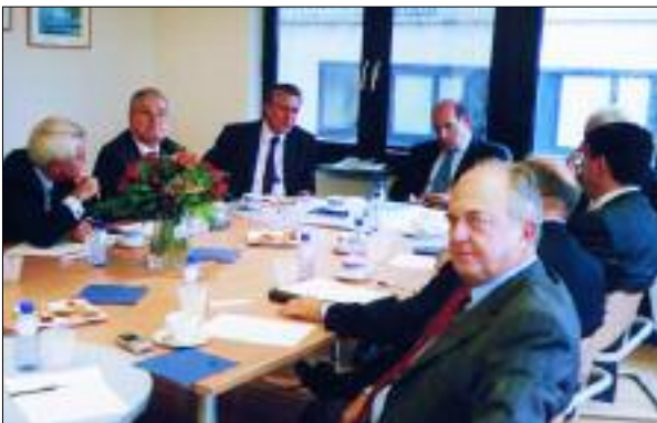
Συνάντηση μελών του Διοικητικού Συμβουλίου του ΣΕΒ με τον Πρόεδρο της UNICE, κ. Ernest-Antoine Seilliere στα γραφεία του Συνδέσμου, στις Βρυξέλλες (21/10/2005)

Το τελευταίο δωδεκάμηνο ο ΣΕΒ κλήθηκε να αντιμετωπίσει σημαντικά ζητήματα αφενός λόγω της ανάπτυξης των δράσεων που αναλαμβάνονται σε κοινοτικό επίπεδο αφετέρου λόγω των νέων δεδομένων για την ευρωπαϊκή ολοκλήρωση που διαμορφώθηκαν από: